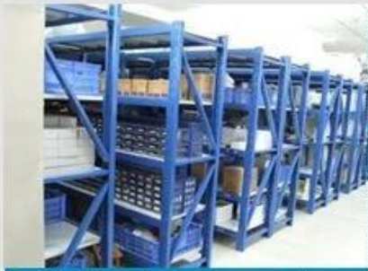
Semi-finished products warehouse